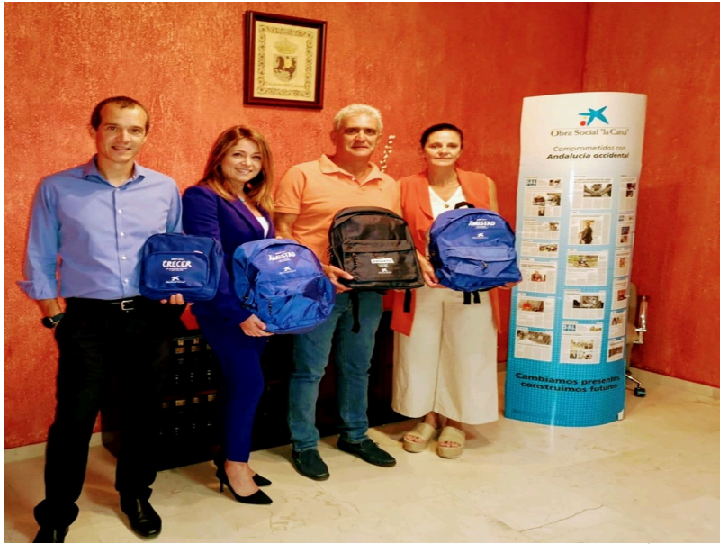
( http://www.escacnadelcampo.es/export/sites/escacena/es/.galleries/noticias/2019/material-escolar-2.jpg )