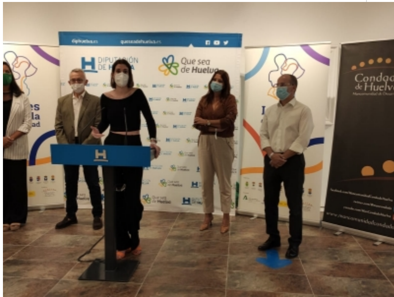
( http://www.escacenadelcampo.es/WhatsApp-Image-2020-09-22-at-11.41.36.jpeg )