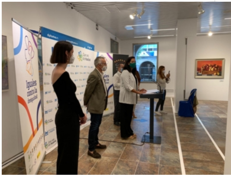
( http://www.escacenadelcampo.es/ICLD-Presentacion4.jpeg )